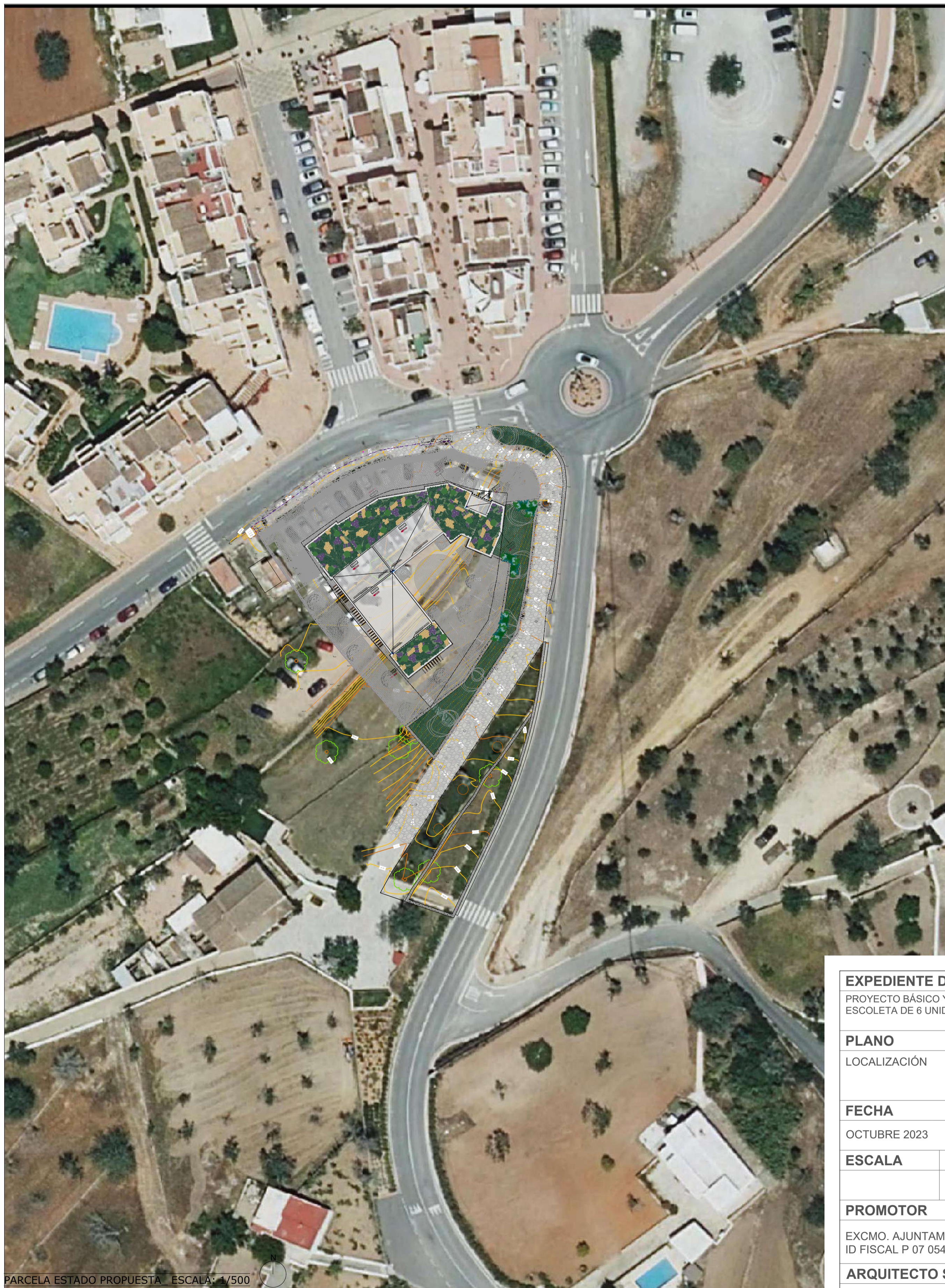
PARCELA ESTADO PROPUESTA ESCALA: 1/500